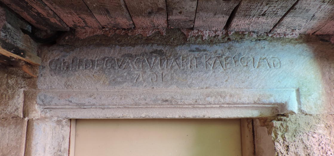
Kamenný nadpražní překlad s tesaným nápisem z roku 1555.